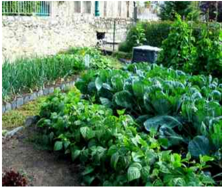
Le potager de la maison