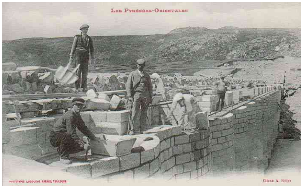
Travail du granit au barrage des Bouillouses

Vient ensuite la période des grands travaux : route dans les années 1850 - 1880, chemin de fer du Train Jaune entre 1910 et 1927. C'est dans ce contexte que commence l'histoire des tailleurs de pierre à Dorres.