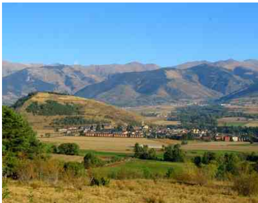
Vue de Llivia depuis le chemin vers Belloc

Avec le Traité des Pyrénées signé en 1659 entre Mazarin et Don Luis de Haro, 33 villages de la Cerdagne dont Llivia, appartenant à la couronne d'Espagne, étaient attribués à la France.