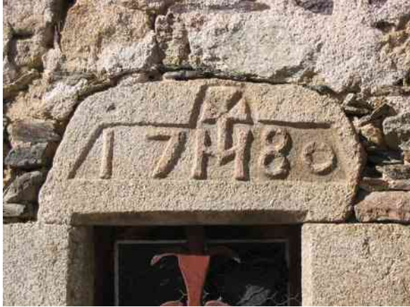
photo n° 1 Fenêtre de la maison de la famille Messa à Dorres (« 17M80 », avec le M de Messa et une croix)

Le village de Dorres existait bien avant le Moyen-Âge. L'église date du XII e siècle.