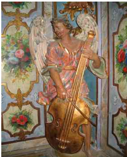
Ange musicien à l'Hermitage de Font-Romeu

Aprês la fin de la guerre de succession d'Espagne (1701 1714) qui opposait la France à l'Espagne, une pêriode de paix en Cerdagne favorisa les êchanges commerciaux et une contrebande prospêre liêe aux conflits voisins.