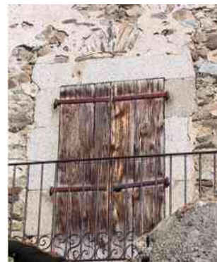
photo n° 4 - La reprise des encadrements de fenêtre est visible une fois le crépi disparu. (Maison Messa)

À la faveur d'une économie meilleure, profitant de l'essor des tailleurs de pierre en Cerdagne, les habitants ont refait les encadrement des fenêtres de leurs maisons avec de belles pierres. Le granit dur est finement façonné et souvent le linteau est orné avec un millésime et les initiales du propriétaire.