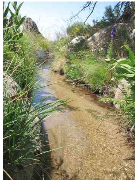
Canal d'arrosage de Dorres

Les rues sont quelquefois bordées d'un caniveau qui coule en permanence : c'est un réseau de canaux qui permettent